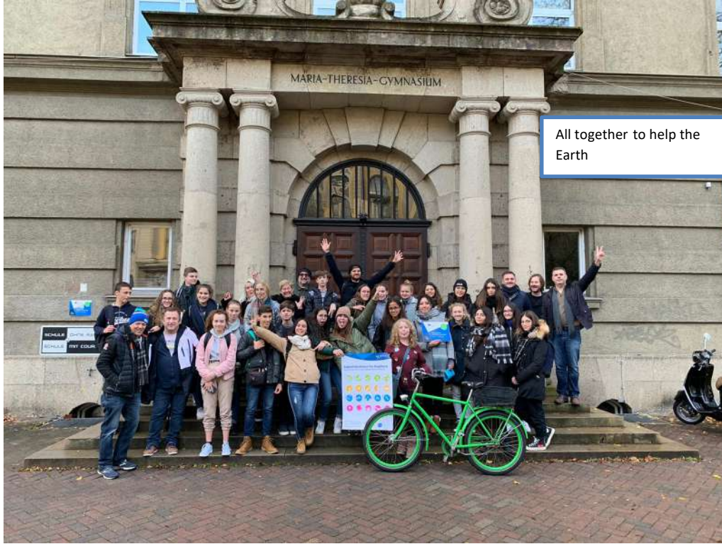
All together to help the Earth