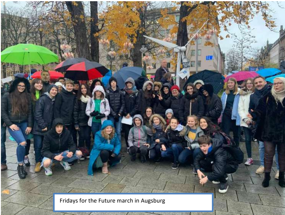
Fridays for the Future march in Augsburg