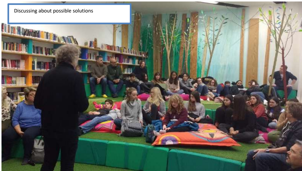
Discussing about possible solutions