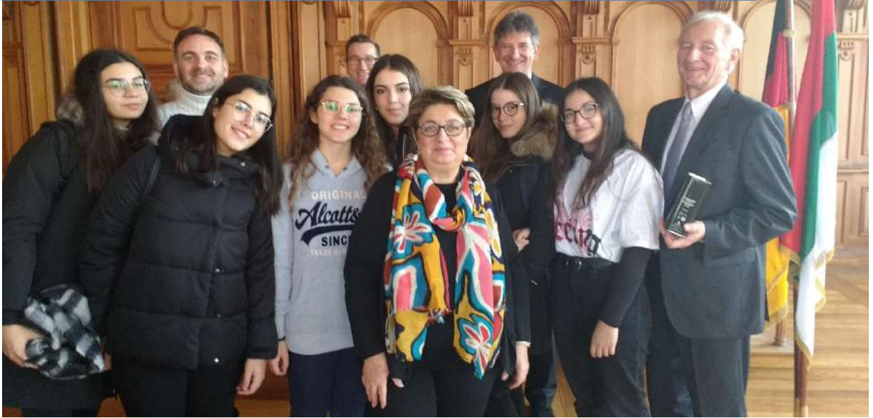
At Augsburg city hall with Maria Theresia Gymnasium principal and the Responsible of Education of the city